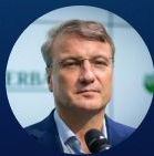
Герман Оскарович Греф

Председатель правления «Сбербанка России»